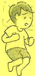
日本小児神経学会のガイドラインや医師への取材から