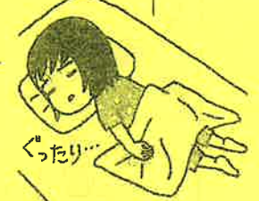
イラスト・岩間みどり